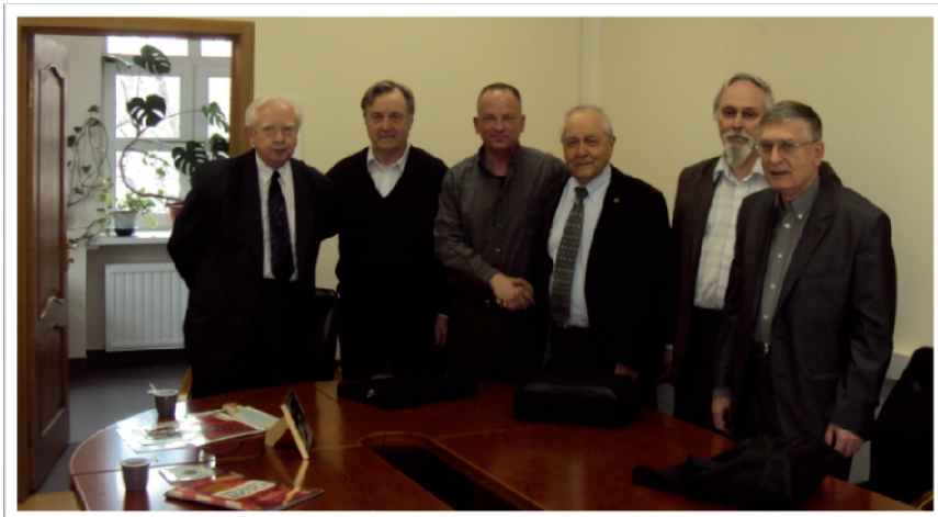
Фигура 4: Академик Н. Н. Пономарев-Степной и российские менеджеры проекта ТОПАЗ-II вместе с автором, Институт Курчатова, Москва, Россия, апрель 2013.