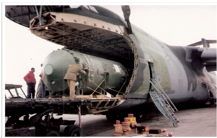
Фигура 2: Погрузка реактора ТОПАЗ-II в транспортном контейнере в самолет С-5 Военно-воздушных сил США, Санкт-Петербург, Россия, апрель 1992.