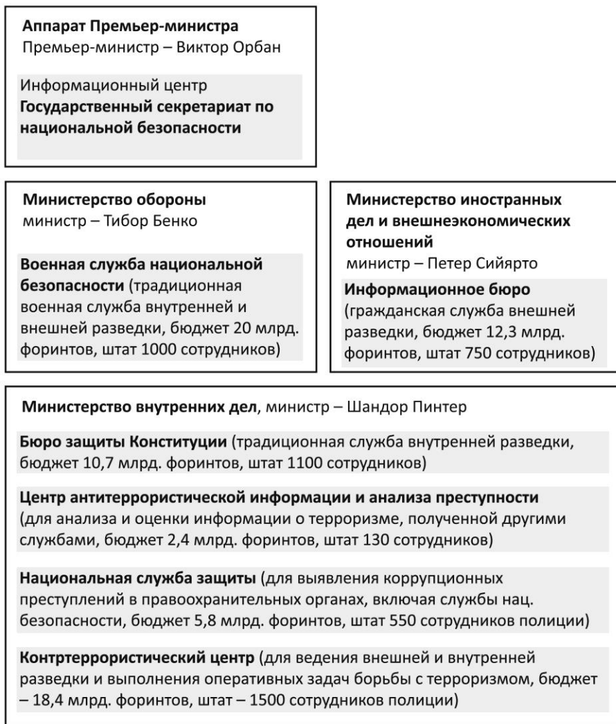
Рис. 1: Службы национальной безопасности Венгрии.

В рамках своих обязательств перед НАТО Венгрия заменяет тяжелую технику сухопутных войск. После танков и артиллерии пришла очередь боевых машин пехоты, составляющих хребет боевых возможностей. Один из ведущих европейских производителей техники сухопутных войск создаст совместное с Венгрией предприятие для производства в Венгрии самых современных боевых машин пехоты.