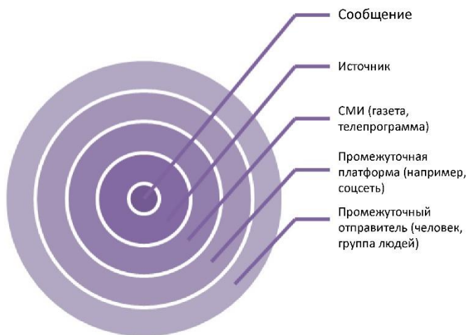
Рис. 3: Пять уровней каналов информации (Karlson & Aalberg, “Social Media and Trust in News”, адаптировано автором).