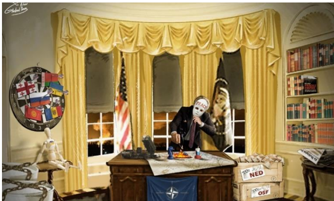
Рис. 1: Карикатура в Global Times , возлагающая вину за войну на США (Global Times, https://www.globaltimes.cn/page/202203/1256665.shtml )